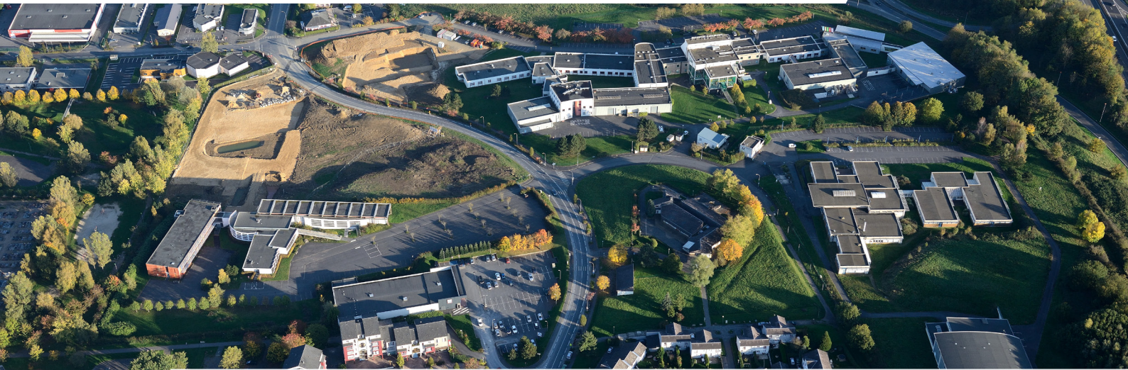
Vue aérienne du chantier du futur campus des Ardennes, sur le site du Moulin Leblanc, à Charleville-Mézières.

Aiglemont Arreux Les Ayyvelles Balaives-et-Butz Balan Bazeilles Belval Boutancourt Chalandry-Élaire La Chapelle Charleville-Mézières Cheveuges Cliron Daigny Damouzy Dom-le-Mesnil Donchery Élan Étrépnigny Fagnon Fleigneux Flize Floing Francheval La Francheville Gernelle Gespunsart Givonne Glaire La Grandville Hannogne-Saint-Martin Haudrecy Houldizy Issancourt-et-Rumel Illy Lumes La Moncelle Montcy-Notre-Dame Neufmanil Nouvion sur Meuse Nouzoville Noyers-Pont-Maugis Poureu-aux-Bois Poureu-Saint-Rémy Prix-lès-Mézières Saint-Aignan Saint-Laurent Saint-Menges Sapogne-Feuchères Sécheval Sedan Thelonne Tournes Villers-Semeuse Villers-sur-Bar Ville-sur-Lumes Vivier-au-Court Vrigne-aux-Bois Vrigne-Meuse Wadelincourt Warcq