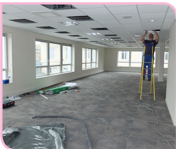
Fin octobre, les ouvriers ont pris possession des lieux pour les aménager selon les besoins de l'ANTS