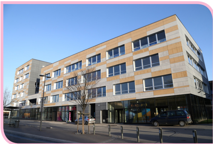
L'ANTS va occuper un plateau de 650 m 2 situé au 2 e étage de Terciarys, près de la gare de Charleville-Mézières